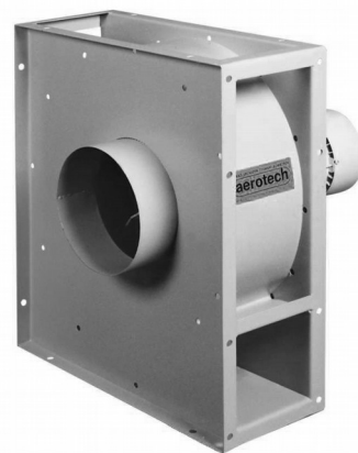
Rysunek wentylatorów serii WPT

Wentylator przeznaczony jest do pracy w pomieszczeniach w zakresie temperatur od -20°C do +40°C i wilgotności do 90%. W stalowej obudowie wentylatora zastosowano otwarty wirnik, samoczyszczący się, spawany z blach stalowych, wyważony dynamicznie, mocowany wprost na wale silnika elektrycznego. Silniki elektryczne, kołnierzone przystosowane do zasilania z sieci trójfazowej 230/400V, 50Hz. Wentylatory serii WPT, produkowane na indywidualne zamówienia, mogą być dodatkowo wyposażone w kompensatory wlotowe i wylotowe, dyfuzory wylotowe, ramy antywibracyjne, obudowy dźwiękochłonne itp.